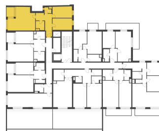
Schéma půdorysu představuje dispoziční řešení bytu. Zobrazené vybavení nábytkem, vestavěné skříně, kuchyňská linka včetně spotřebičů a pračky nejsou součástí dodávky bytu. Toto vybavení je zobrazeno pouze pro názornost. Celková podlahová plocha je vypočtena dle nařízení vlády č. 366/2013 Sb. Veškeré informace jakkoliv publikované v tomto dokumentu jsou nezávazné marketingové informace obecné povahy, které nelze vykládat jako nabídku na uzavření smlouvy ani se jich nelze dovolávat.

+420 226 292 876 info@homeportal.cz www.homeportal.cz